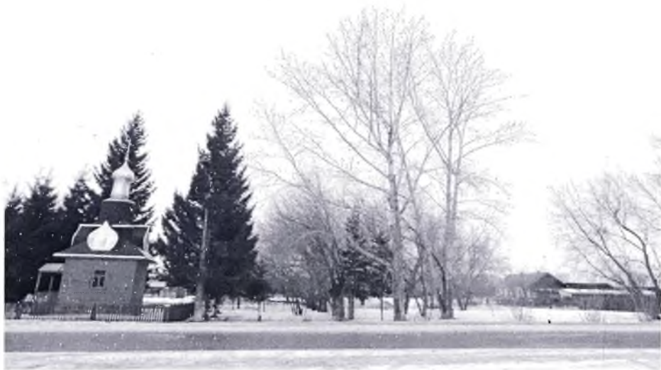
ул. Бородинская до оборудования сквера «Подвиг их бессмертен»