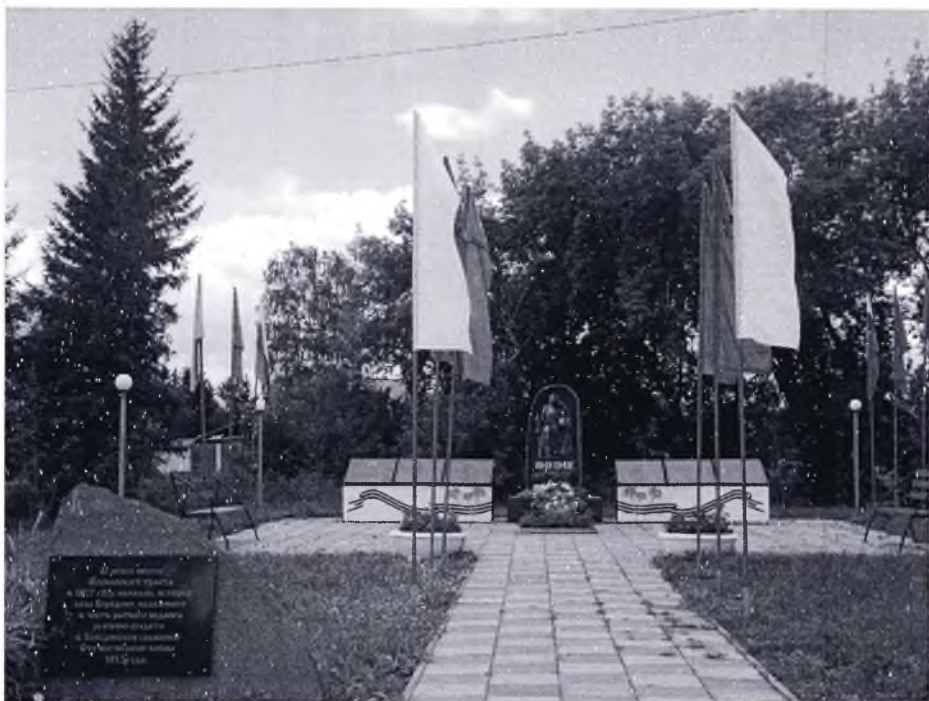
Круглогодично мемориал «Подвиг их бессмертен» находится в ухоженном состоянии, трава скашивается, в вазонах цветет красная сальвия, снег убирается.